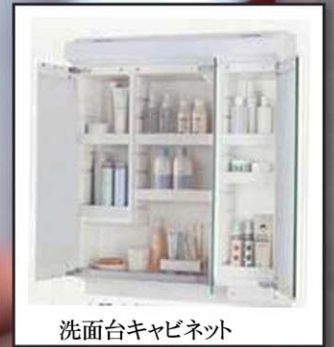
洗面台キャビネット