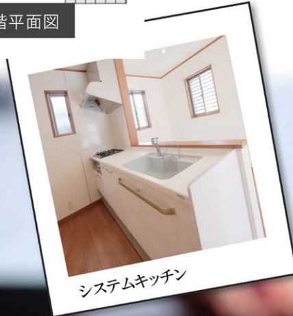
システムキッチン